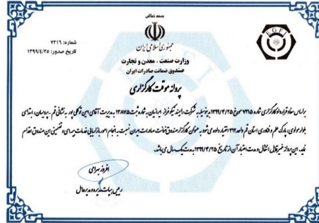
مجوز کارگزاری صندوق ضمانت صادرات ایران