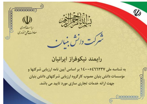
مجوز شرکت دانش بنیان