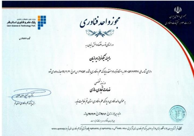
مجوز واحد فناوری پارک علم و فناوری