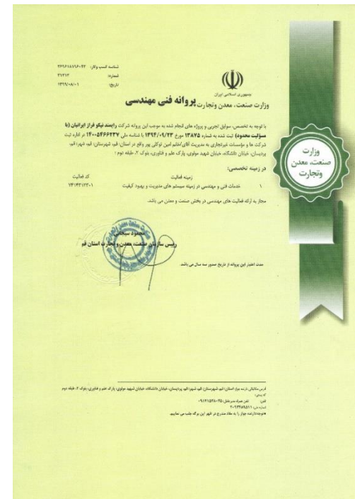
پروانه خدمات فنی و مهندسی از وزارت صمت