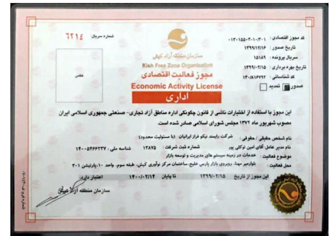
مجوز فعالیت اقتصادی در جزیره کیش