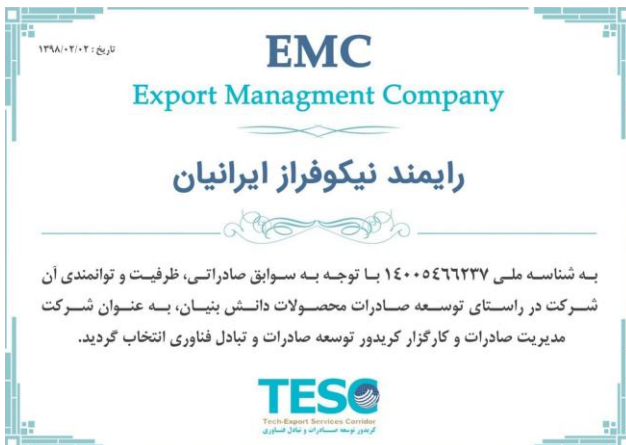
مجوز شرکت مدیریت صادرات (emc)